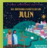
Den supercoola berättelsen om julen , barnbok på rim. Pris 20 kr. Art nr 2563