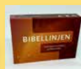
Bibellinjen - spel Vilken bok ligger var? Placera bibelböckerna i rätt ordning. Innehåller 66 kort med bibelböcker och regelbok. Pris 179 kr. Art nr 2575