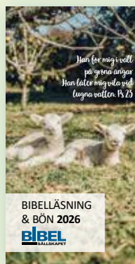
Bibelläsning & bön 2026 , bibelläsningplan. Pris 20 kr. Art nr 2185

Den supercoola berättelsen om Jesus , en häftad, tunn barnbok med text på rim. Passar för utdelning. Pris 20 kr. Art nr 2513