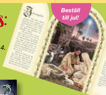
Julkort 2025 , med Luk 2:1-14. Pris 10 kr. Art nr 862