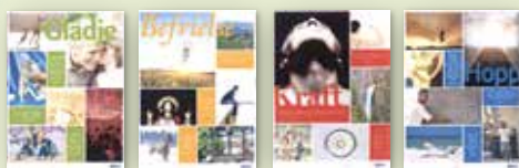
Bibela ffischer i set om fyra med tema Gladje, Befrielse, Kraft och Hopp. Bibelverser i färgfälten. Pris 50 kr. Art nr 1704