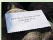
Bibelmanna kort, bunt med 168 kort. Pris 10 kr. Art nr 1165

Den supercoola berättelsen om Jesus , en häftad, tunn barnbok med text på rim. Passar för utdelning. Pris 20 kr. Art nr 2513