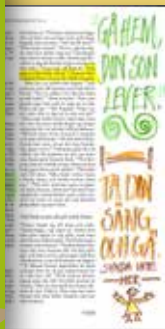
Skapande-bibeln , utgåva av Bibel 2000 med extra breda marginaler för den som vill anteckna eller illustrera. Låt bibelläsningen få vara ett äventyr på det sätt som passar dig! Pris 599 kr. Art nr 3000