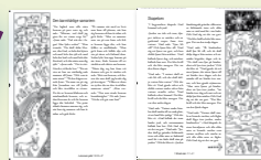
Räkna stjärnorna , innehåller 15 av Bibelns mest kända texter och dekorbilder att färglägga. Pris 10 kr. Art nr 2161 (OBS! Gratis för Bibelsällskapets stödförasmlingar.)