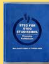
Steg för steg - studiebibel , Folkbibelns översättning. En rik resurs för fascinerande fördjupning i Bibelns värld. Lättillgänglig och faktaspäckad för nyfikna bibelläsare, pastorer och bibelskoleelever. Pris 689 kr. Art nr 2812