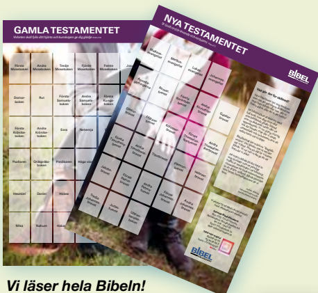
Vi läser hela Bibeln! Två affischer med läsplan och rutor för varje bibelbok där man kan markera att man läst eller jobbat med texten. Skickas i pappör. 70x100 cm. Pris 50 kr. Art nr 2422