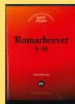
Kommentarsserien KNT , har flera utgåvor. Den senaste i raden är Romarbrevet - KNT 6B . Böckerna är för den som på allvar vill arbeta med de bibliska texterna. KNT förutsätter inga kunskaper i Bibelns grundspråk. Pris 549 kr. Art nr 3060