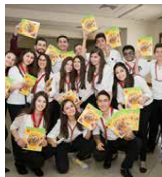
Bibelsällskapet har åldersanpassat bibelmaterial, här levererat till en ungdomsgrupp i Damaskus.